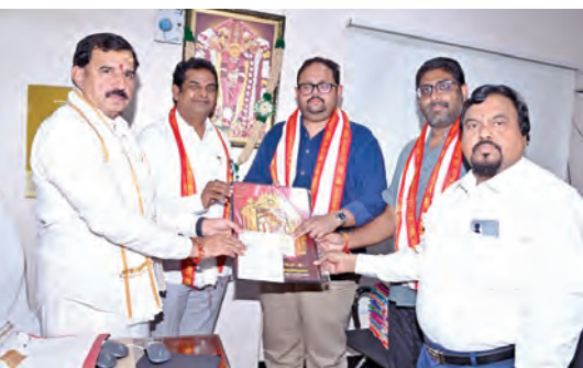
అన్నదానానికి విరాళమిచ్చిన దాతలకు దుర్గమ్మచిత్రపటం అందిస్తున్న శ్రీశ్రీ

ఆంధ్రకీర్తి, నవంబర్ 9, ప్రభాత వార్తా : దుర్గమ్మవారి ఆలయంలో ప్రవీణ కార్తికమాస పూజలు శనివారం భక్తిశ్రద్ధలతో నిర్వహించారు. ఈ సందర్భంగా ప్రదోపకాలంలో ఆశాదీపాన్ని వెలిగించారు. మధ్యాహ్నం 3.30గంటల నుండి సాయంత్రం 7 వరకు సహస్ర లింగార్చన, ఉదయం 8 గంటలనుండి 11 వరకు కారక